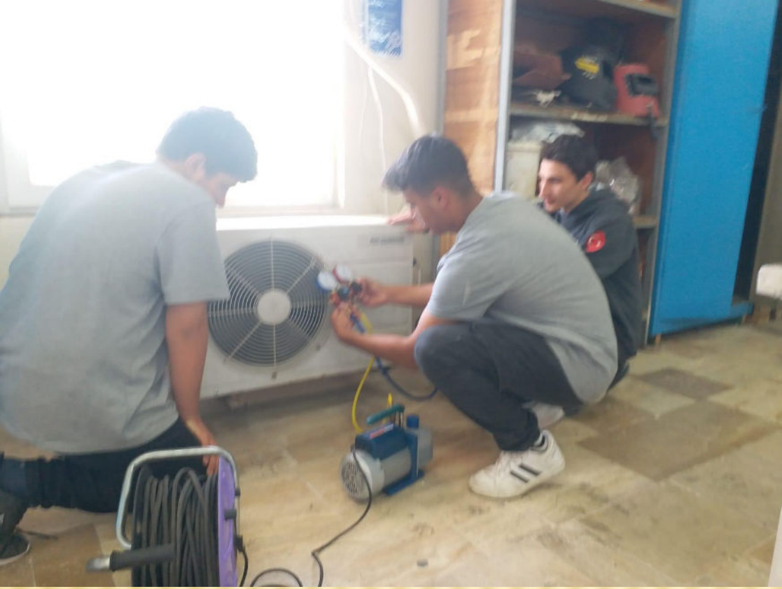
Klimaya Gaz Basma Öncesi Vakumlama Uygulaması