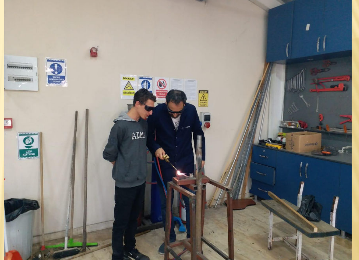
Oksi – Gaz Kaynak Uygulaması