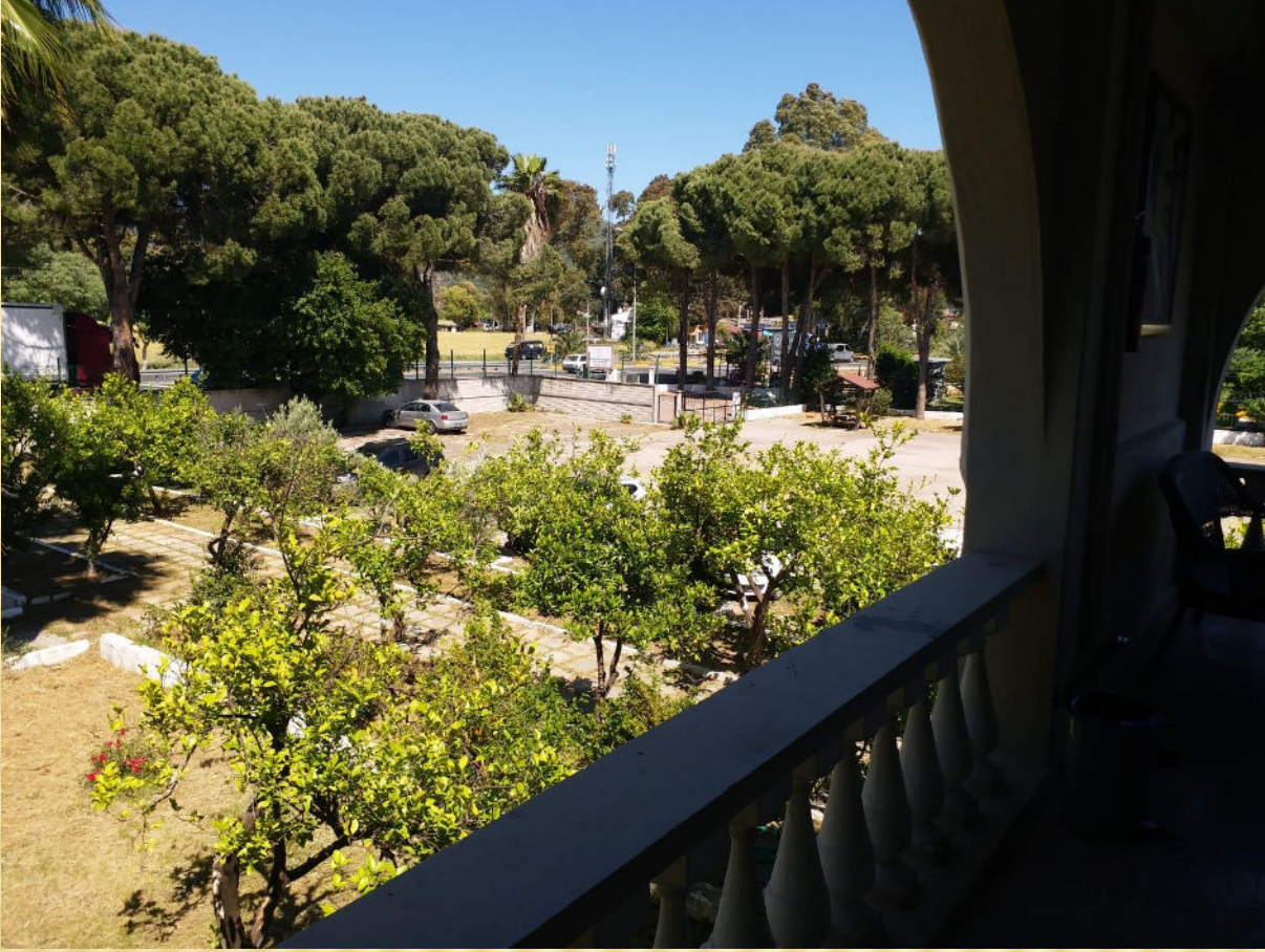
Okulumu Ön Bahçesinden Görünüm