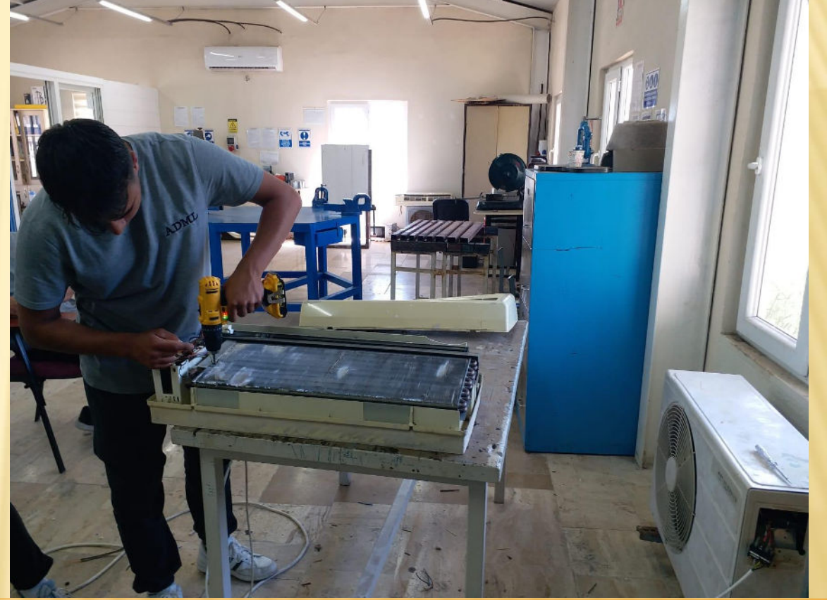
Klima İç Ünite Tamiri