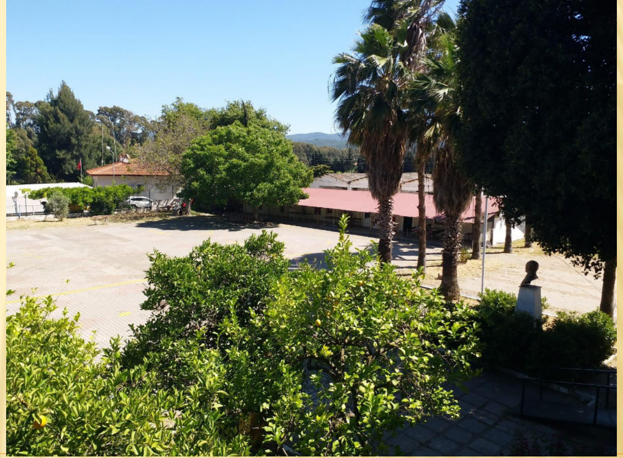
Okulumu Ön Bahçesinden Görünüm