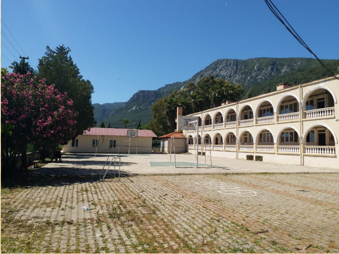
Futbol, Basket ve Voleybol Sahamız