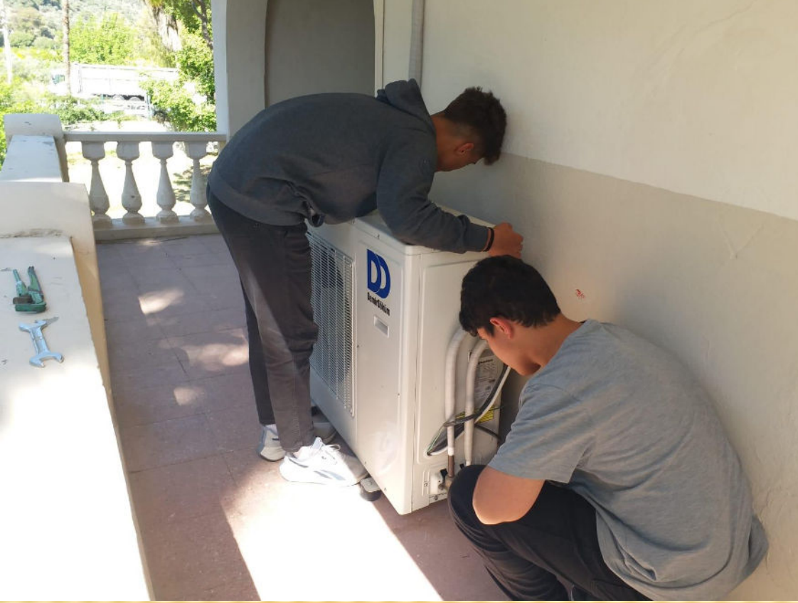
Klima Dış Ünite Tamiri