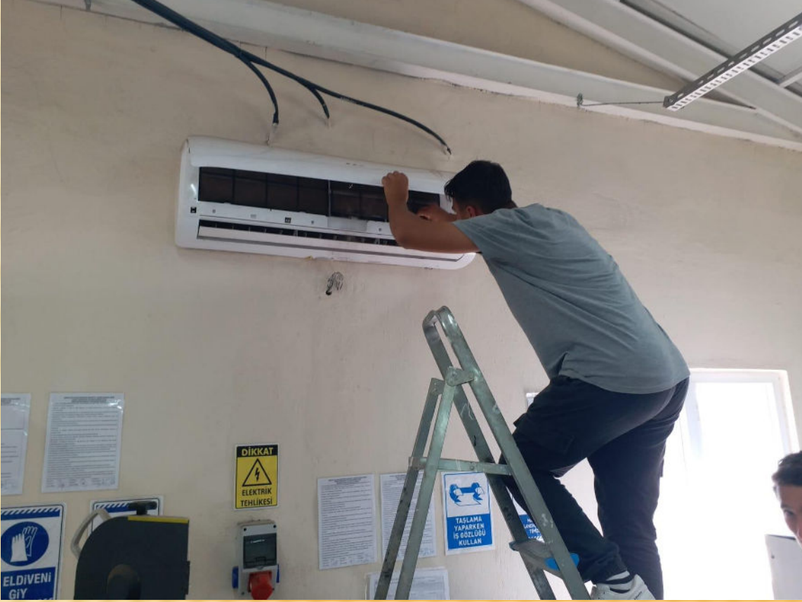
Klima Bakım Uygulaması